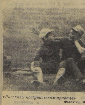
«Рисовка на туркестком привале»