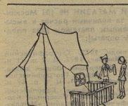
— Я дома привык спать на балконе.